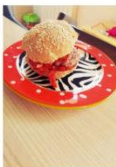
Fast food aux petits pains maison