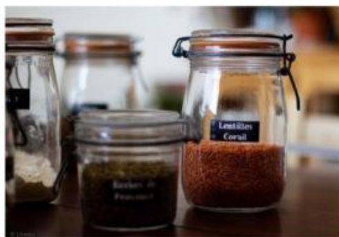
Rangement et étiquetage de bocaux