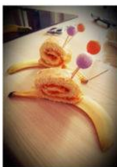
Gâteau roulé Clin d'oeil Slow péda