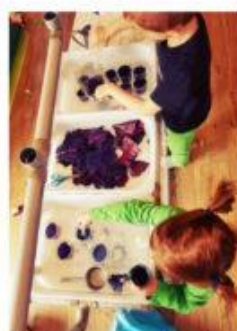
Expérience au jus de chou rouge