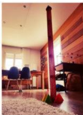
Concours de grattes-ciels