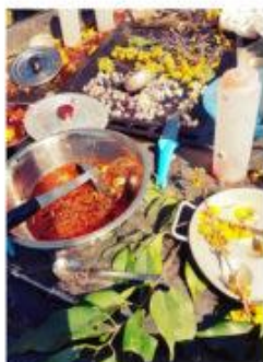
Soupe de fleurs