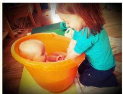
Bain autonome du petit frère