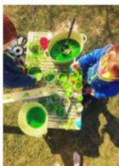
Souple gluante au tapioca