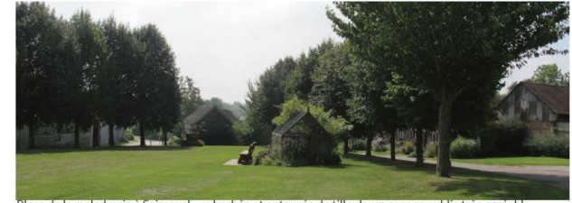
Place de la maladrerie à Saisseval, enherbée et entourée de tilleuls, un espace public très agréable

Les espaces publics constituent un élément essentiel de la morphologie urbaine ouest amiénoise. Plusieurs éléments composent ces espaces publics : peu d'espaces publics dans la vallée de la Somme où l'espace est compté et le tissu urbain plus dense ; des espaces publics liés à la dilatation de la voie publique ; sur les plateaux les espaces publics sont organisés autour des mares, des édifices à vocation publique ou des espaces enherbés. Néanmoins, aujourd'hui, l'usage des espaces publics est parfois indéterminé (stationnement, ...). La centralité est peu marquée, ayant pour conséquence la perte progressive de fédération et de polarisation des bâtiments limitrophes.