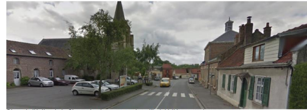
Place de l'église de la Chaussée-tirancourt aujourd'hui dédiée au stationnement