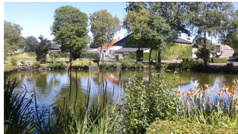
Mare de Seux

Ces éléments sont parfois peu mis en valeur et dégradés. Ces éléments étant constitutifs de l'identité des bourgs et des communes, il convient d'en prendre soin pour assurer des espaces publics qualitatifs.